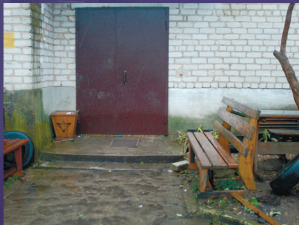
ВИДОВАЯ ТОЧКА 14. ПРОЕЗД ПЕРЕД ДОМОМ №25