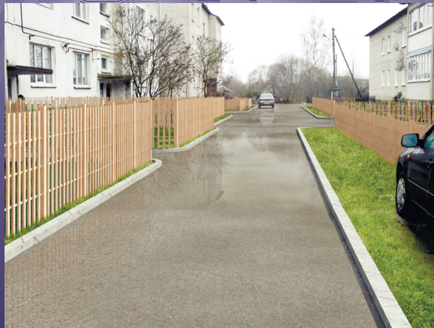
ВИДОВАЯ ТОЧКА 8. ПРОЕЗД МЕЖДУ ДОМАМИ №9, 25