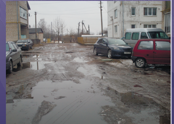
ВИДОВАЯ ТОЧКА 13. ПРОЕЗД МЕЖДУ ДОМАМИ №25, 27