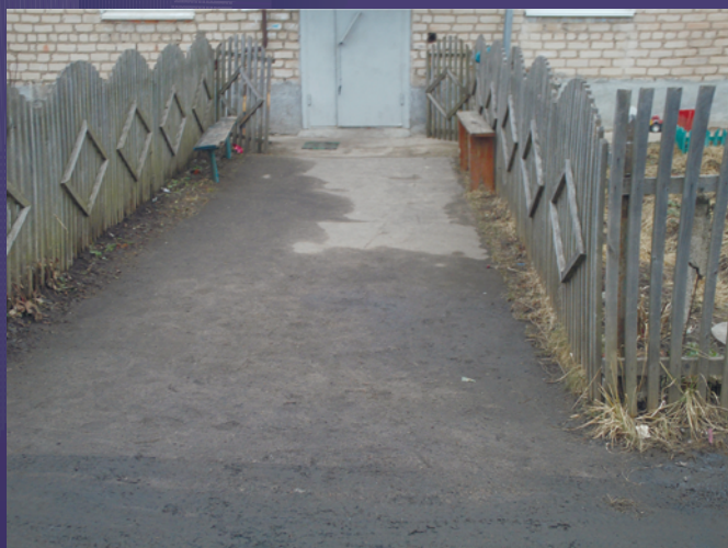
ВИДОВАЯ ТОЧКА 4. ПРОЕЗД МЕЖДУ ДОМАМИ №7,27