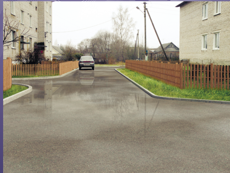
ВИДОВАЯ ТОЧКА 10. ПРОЕЗД МЕЖДУ ДОМАМИ №9а, 25