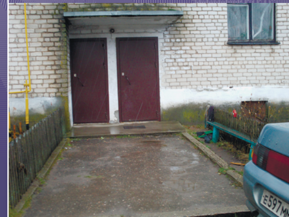
ВИДОВАЯ ТОЧКА 11. ЖИЛОЙ ДОМ №9а