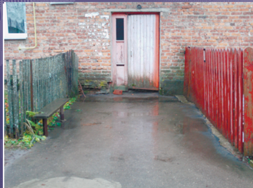
ВИДОВАЯ ТОЧКА 19. ПРОЕЗД ПЕРЕД ДОМОМ №31