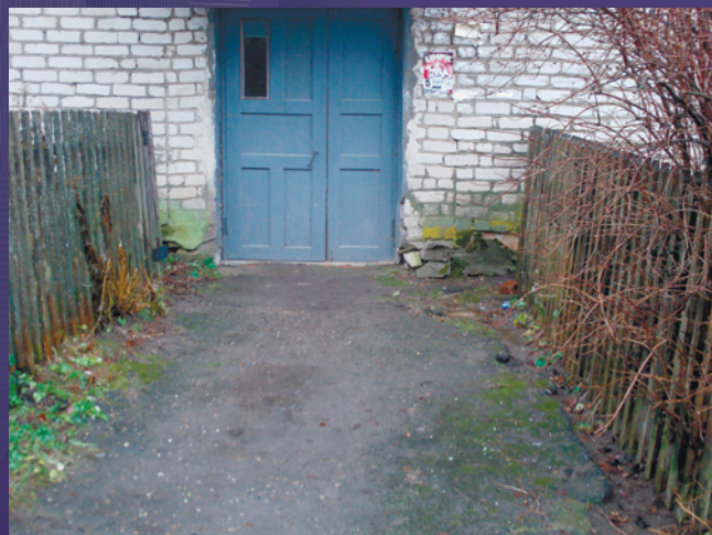
ВИДОВАЯ ТОЧКА 16. ПРОЕЗД ПЕРЕД ДОМОМ №33